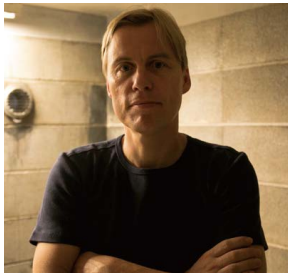
グレゴール・シュナイダー